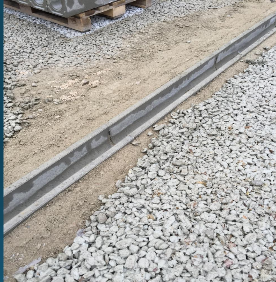
Betonnen Lijngoot Type BGU ND 100 nr. 10/0