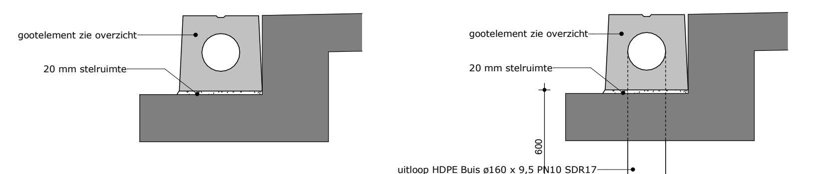
Drsn goot 1 : 20