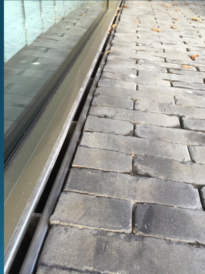
Excentrische Sleufbovendeeel uit RVS 2mm