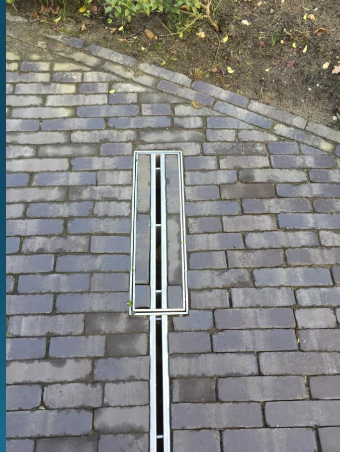
Centrisch Sleufbovendeel uit RVS