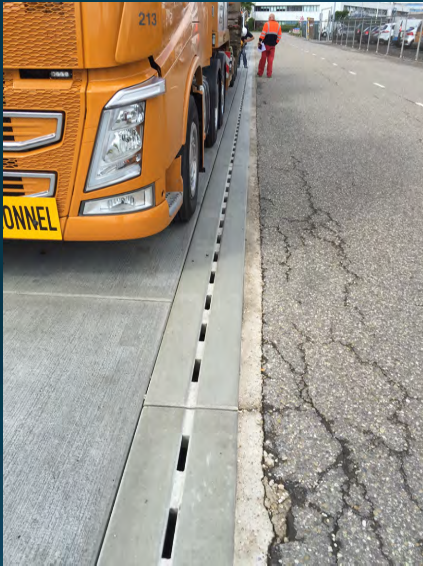
Toegankelijk voor Zwaar verkeer