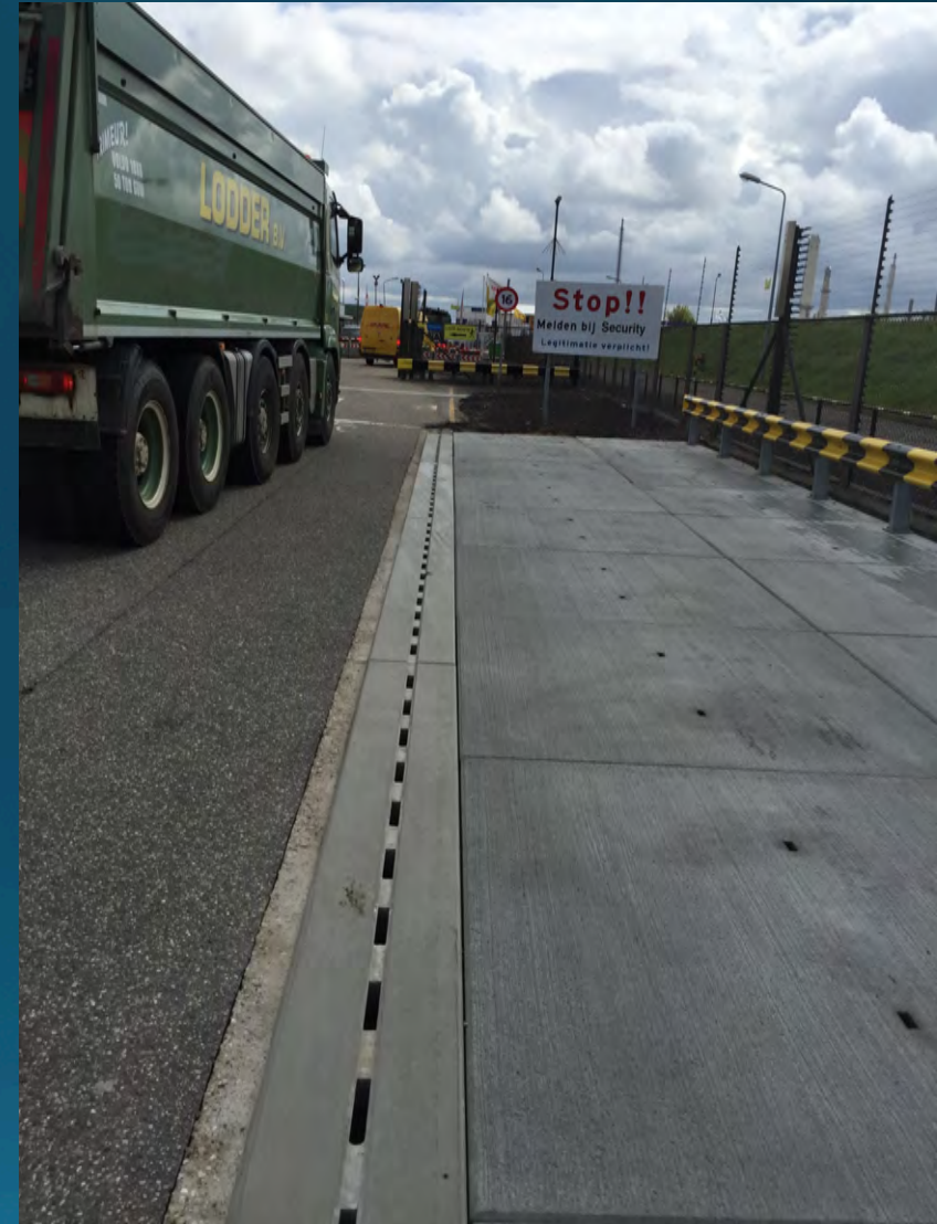
Doorgang aangemeld verkeer mogelijk!!