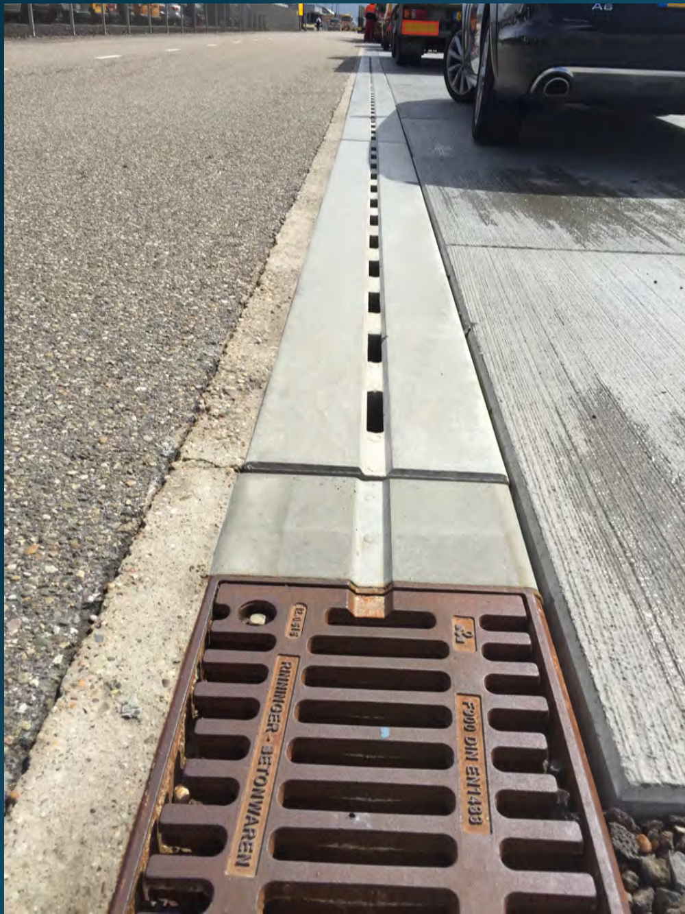
Afwatering middels zandvanger incl. Zwaar verkeer rooster Belasting klasse F900 volgens NEN-EN 1433